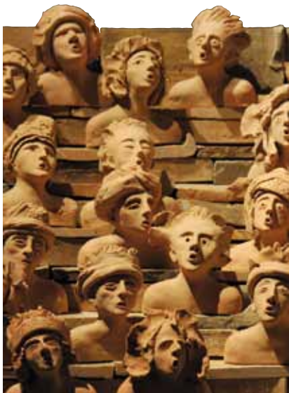
Les Choreutes, sculpture d'Odile Levigoureux